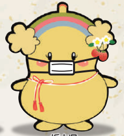
栃木県 老人福祉施設協議会 イメージキャラクター とちふくちゃん