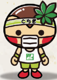
栃木県マスコット キャラクター とちまるくん