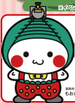
真岡市イメージキャラクター もおかびよん