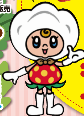
真岡市イメージキャラクター コットベリーちゃん